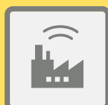
ГУДКИ ПРЕДПРИЯТИЙ И ТРАНСПОРТНЫХ СРЕДСТВ